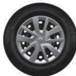
Calotas Magiceo 15"