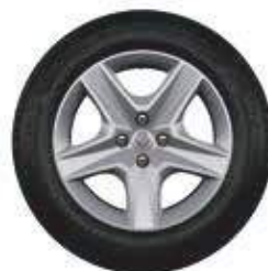
Ruedas Flexwheel Oasis 16"